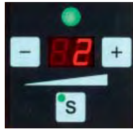
Bandspänningen ställs in med touchknappar