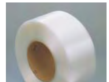
Prisvärda band för skonsam bandning