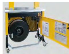
Robust, kompakt konstruktion