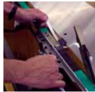
Underhåll utan verktyg