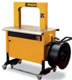
Robuste, kompakte Konstruktion