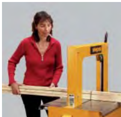
Als freistehende Maschine oder für Integration in Fördersysteme