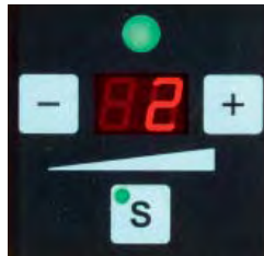
Bandspannung einstellbar über Drucktaste