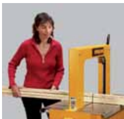
Pour l'utilisation comme machine individuelle ou pour intégration dans une chaîne de convoyeurs