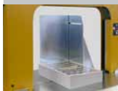
Taquage pour aligner des paquets lâches