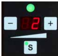
Réglage simple de la tension par bouton-poussoir