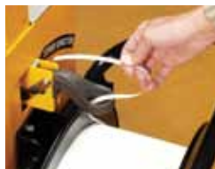
Remplacement simple de la bobine