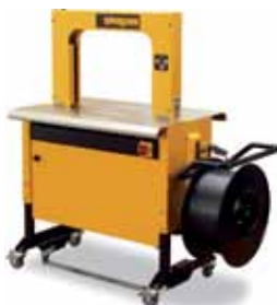
Construction robuste et compacte