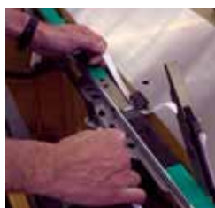
Pas d'outils nécessaires pour la maintenance