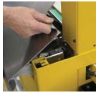
Koneen avaus helposti