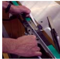
Huolto ilman työkaluja