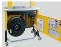
Vahva, kompakti muotoilu