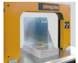
Sidontapysäyttimet varmistamaan irrallisten pakettien paikka