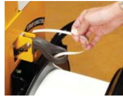
Helppo kelan vaihto