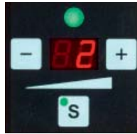
Vannekireys helposti säädettävissä painonapilla