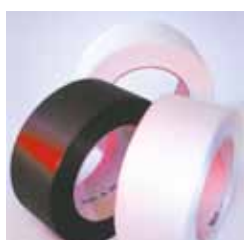
Des feuillards économiques pour un cerclage efficace Utilisation de feuillards PP de faible épaisseur