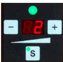
Réglage simple de la tension par bouton-poussoir