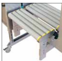
Options Adaptable aux situations générales d'exploitation et aux exigences particulières