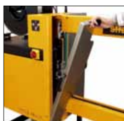
Accessibilité optimale, pas d'outils nécessaires pour la maintenance