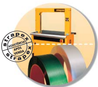
Máquina, Cinta e Assistência Técnica como um pacote global