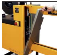
Fácil acesso, manutenção sem ferramentas