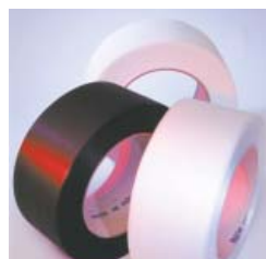
Cintas para uma cintagem económica Utilização de cintas finas de PP