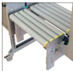
Opções Adaptável às diversas condições de trabalho