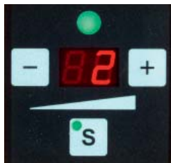
Tensionamento da cinta ajustável por botão