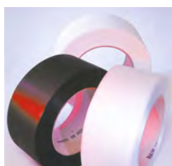
Des feuilards économiques pour un cerclage efficace Utilisation de feuilards légers PP