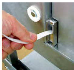
Changement rapide du rouleau, alimentation automatique du feuilard