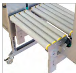
Options Adaptable pour des conditions de travail et des exigences différentes

Le Service complet: Machine, feuilard et service après-vente