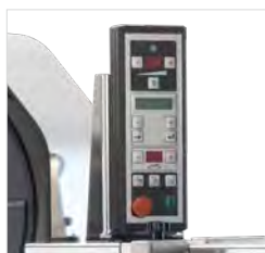
Réglages simples, tableau de commande pivotant