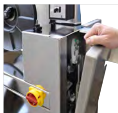
Accessibilité optimale, entretien minimal nécessaire