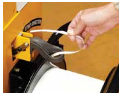
Hurtigt og nemt båndrulleskift