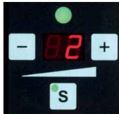
Nem indstilling af båndstramning ved hjælp af trykknop