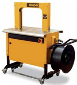
En robust og kompakt konstruktion