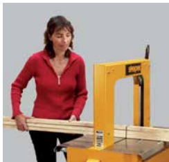
Som fritstående maskine eller til integration i transportsystemer