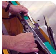
Vedligeholdelse uden brug af værktøj