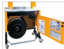
En robust og kompakt konstruktion