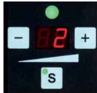
Nem indstilling af båndstramning ved hjælp af trykknop