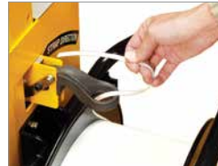
Hurtigt og nemt båndrulleskift