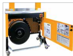
Robust og kompakt