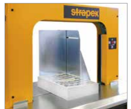
Bunstoppere sikker båndplassering på løse bunter