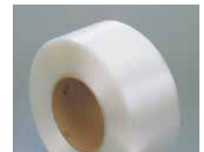
Prisvärda band för skonsam bandning