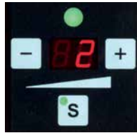
Bandspänningen ställs in med touchknappar