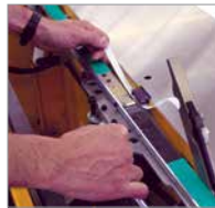
Underhåll utan verktyg