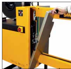
Optimal tilgængelighed og vedligeholdelse uden brug af værktøj