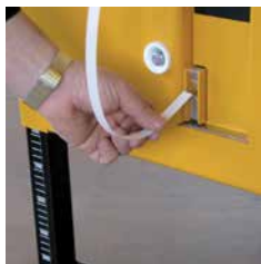
Hurtigt og nemt båndrulleskift