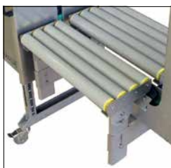
Optioner Rullebord med fritløbende ruller for optimal tilpasning til forskellige arbejdsforhold og krav

Strapex tilbyder en totalløsning med maskine, omsnøringsbånd og kundeservice