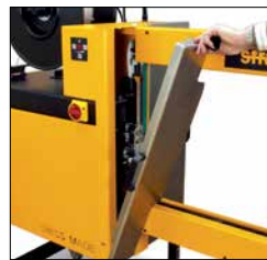
Fácilmente accesible, mantenimiento sin herramientas