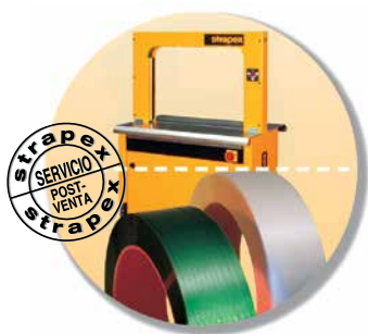
Máquina, fleje y servicio post-venta como un único responsable