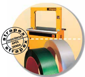
Máquina, Cinta e Assistência Técnica como um pacote global