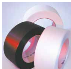
Cintas para uma cintagem económica Utilização de cintas finas de PP