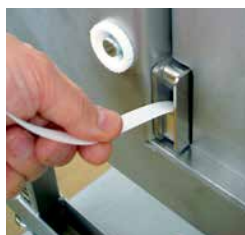
Hurtig udskiftning af spole, automatisk indsætning af strop