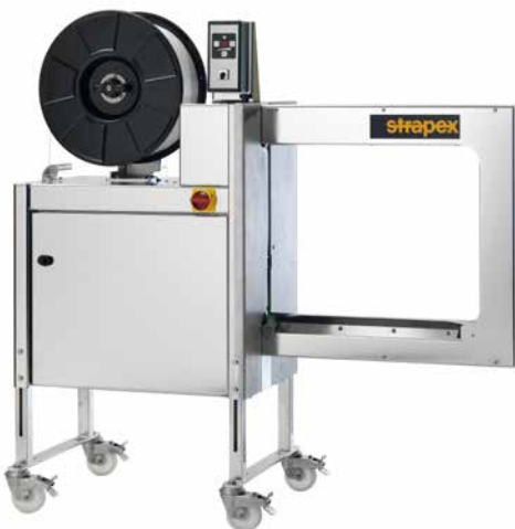
SMG 65i / SMG 65iS