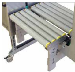
Forskellige optioner Kan tilpasses efter forskellige driftsforhold og krav