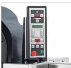
Enkelte justeringer, drejeligt kontrolpanel