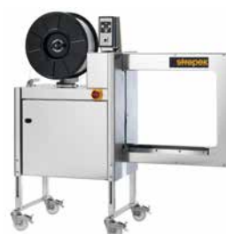
SMG 65i, 65iS Som enkeltstående maskine eller til integrering i transportørsystemer