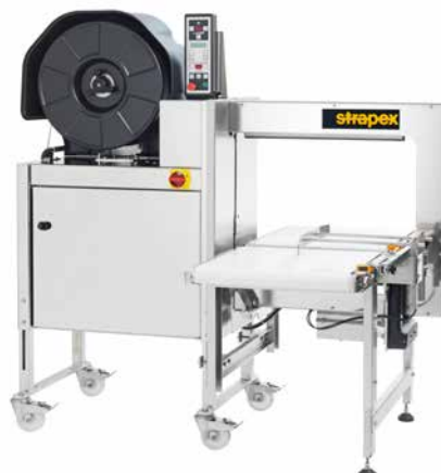
SMG 75i / SMG 75iS