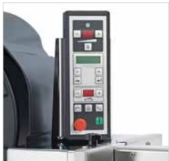
Ajuste fácil de la tensión de fleje con pulsador