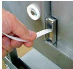
Fácil cambio de bobina